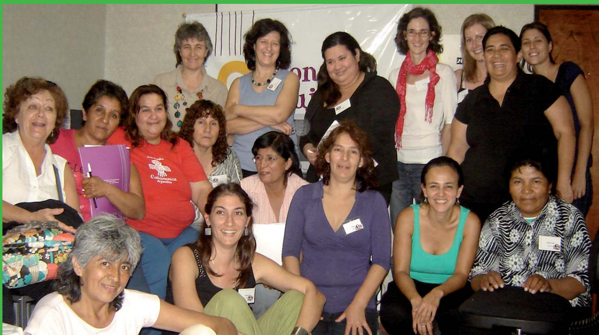
Encuentro REDAL 2010, realizado en Córdoba, abril de 2011

Al obstáculo geográfico, se agrega el doble obstáculo cultural de ser mujeres e indígenas. Según el último Censo, en los hogares rurales el 44% de las mujeres mayores de 14 años no habían completado la enseñanza primaria.