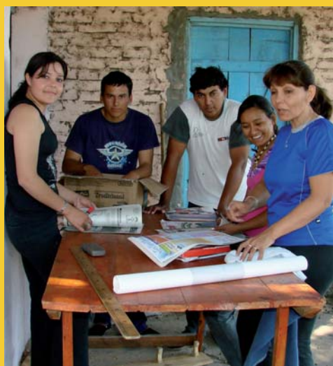
Apostando al Futuro - Chaco - Argentina