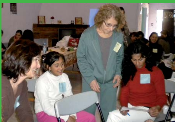
Mujeres de la Costa - San Javier - Santa Fé - Argentina

Ambos apoyos son continuos por ciclos de hasta 5 años.