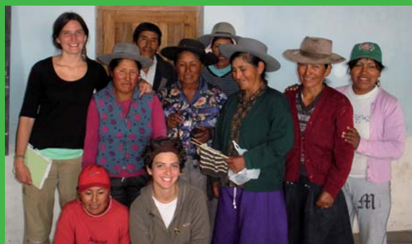
Grupo de Género "Red Puna" - Jujuy - Argentina