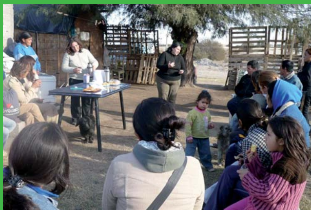
Grupo de Mujeres de "La Batea" - Catamarca - Argentina