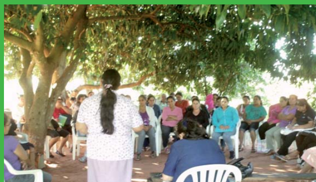
Coor. Departamental de Mujeres de San Pedro - Paraguay