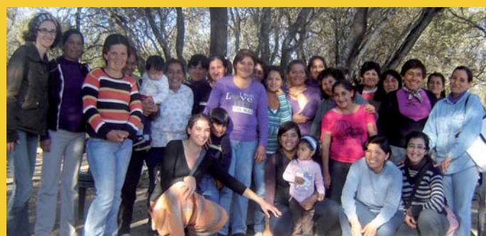
Unidas por un Futuro - Río Muerto - Santiago del Estero - Argentina