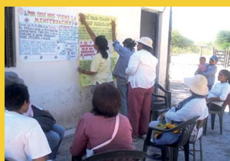
Juntas Triunfaremos - La Invernada Sur - Santiago del Estero - Argentina